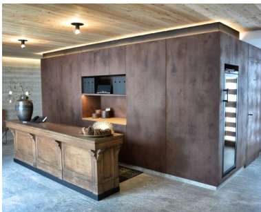
Organoid Technologies Roscht