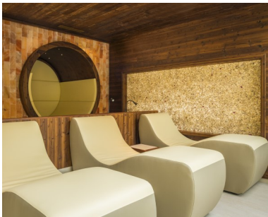
Organoid Wildspitze Roasa